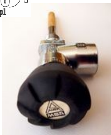
Zawór pojedynczy AUER MSA DIN 300 bar gwint do butli M18X1,5 lub 17E