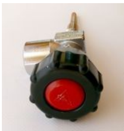
Zawór pojedynczy AUER DIN 300 bar gwint do butli M18X1,5