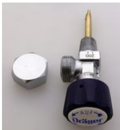
Zawór pojedynczy DRAGER TLEN 200 bar gwint do butli stożek 17E