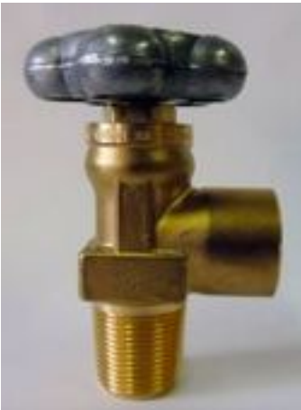
Zawór pojedynczy techniczny DIN na 200 lub 300 bar gwint do butli stożek 25E różni producenci MULLER, GCE itp.