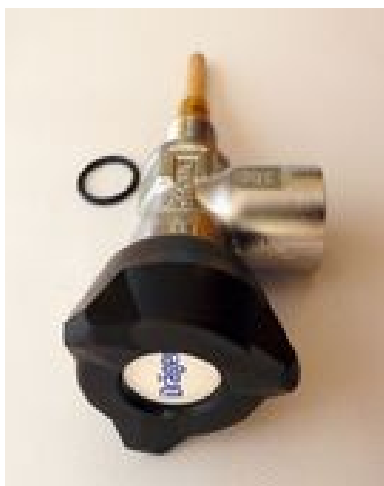
Zawór pojedynczy DRAGER DIN 300 bar gwint do butli M18X1,5 lub 17E