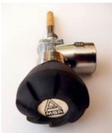
Zawór pojedynczy AUER/MSA DIN 300 bar gwint do butli M18X1,5 lub 17E